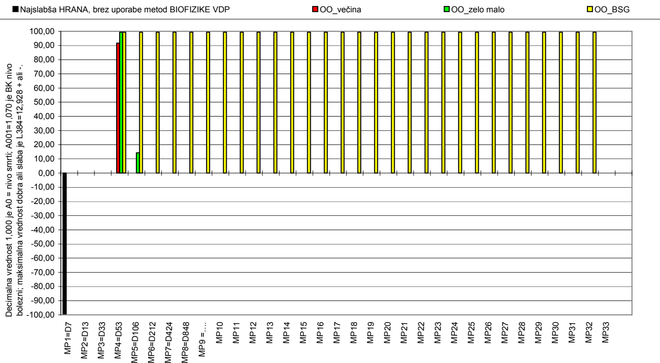
Diagram kakovosti HRANE, PIJAČE, ZDRAVIL, KOZMETIKE itd, po uporabi metod GA, AP, BT

BK STATUS BIOparametrov v merilnih poljih MP1 do MP32. MP1=-L384 predstavlja nivo najslabše kakovosti.